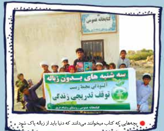
بچه‌هایی که کتاب می‌خوانند می‌دانند که دنیا باید از زباله پاک شود

یکی از مهم‌ترین فایده‌های کتابخانه این بود که در کنارش توانستم برخی از خانواده‌هایی که اجازه‌ی مدرسه رفتن به فرزندانشان را نمی‌دادند، راضی کنم تا به مدرسه بروند و درسشان را ادامه بدهند.