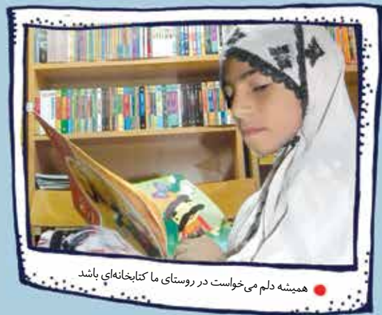
همیشه دلم می‌خواست در روستای ما کتابخانه‌ای باشد

کتاب، انسان‌ساز است و وقتی ما انسانیت را بیاموزیم، می‌توانیم از حق خودمان دفاع کنیم. آدم‌هایی که کتاب می‌خوانند، حرفی برای گفتن دارند و اگر چیزهایی که در کتاب می‌خوانند در زندگی خود به کار ببرند، دیگر سرشان کلاه نمی‌رود.